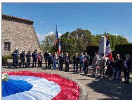
Commémoration du 8 mai