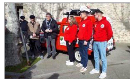
Repas organisé par l'ACCA au profit de 4L Trophy