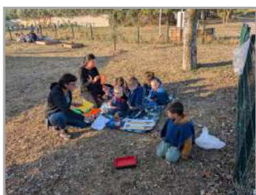
Classe dehors des PS/MS au jardin pédagogique le 16/10/2025