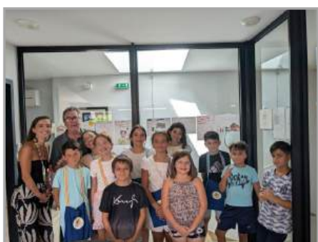
Remise des cadeaux aux CM2 le 04/07/2025

Le jardin pédagogique au Moulin reçoit régulièrement la classe des PS et MS pour la « classe dehors ». Des plantations ont été réalisées.