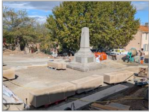
Déplacement du monument aux morts