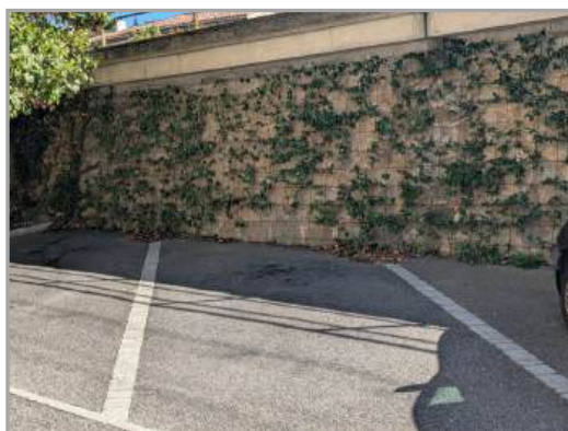
Verdissement du pont de la SNCF par David Jardins Passion de CONILHAC-CORBIERES