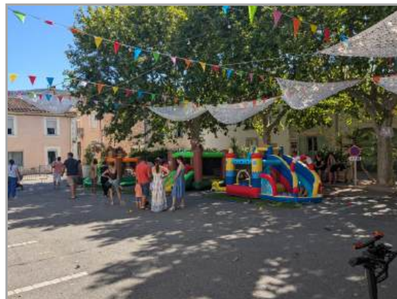
Repas du 13 juillet et jeux gonflables pour les enfants le 14 juillet organisé par le Comité d'animation