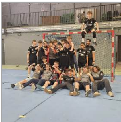
Finale régionale des moins de 15 ans du Handball Club Barbaira Alaric au grand palais des sports à Toulouse

Sur le plan sportif le club aligne aujourd'hui cinq équipes :