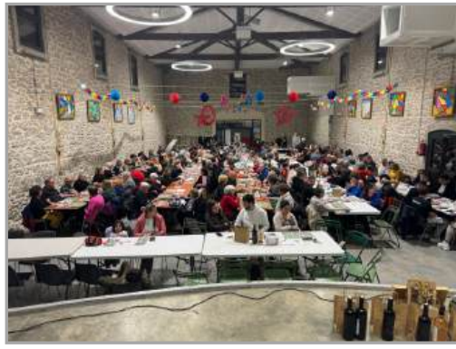
Loto organisé par le Hand-Ball Club Barbaira Alaric