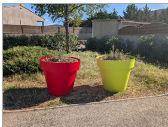
Entrée du lotissement du Bouquet. Plantation de plantes méditerranéennes ne nécessitant pas d'eau