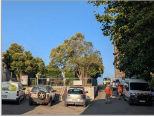
Photo avant les travaux