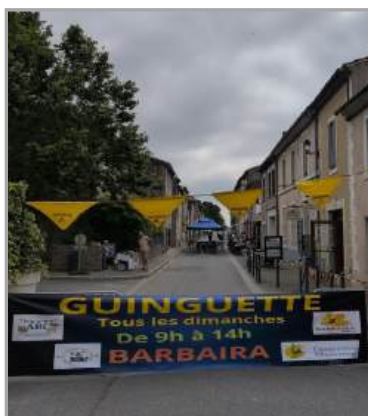
La guinguette organisée par l'association Barbairanaise des Commerçants