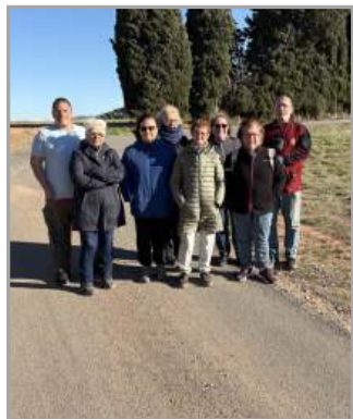
Randonnées du mardi organisées par le FACS