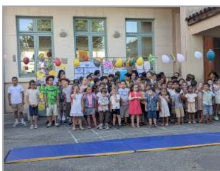
Spectacle de fin d'année le 30/06/2025