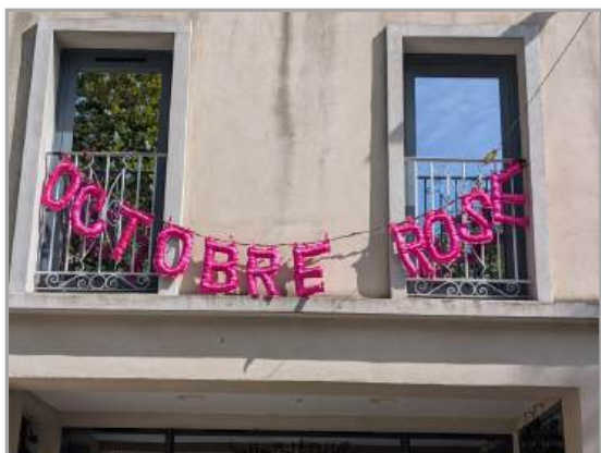
Façade de l'espace culturel et associatif décoré par les loisirs créatifs pour octobre rose