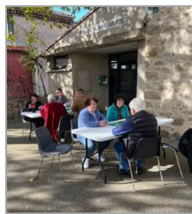
Après-midi jeux de société organisés par le FACS