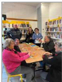
Atelier informatique seniors

Les associations, Générations Mouvement, FACS, Comité d'Animation, Gymnastique Volontaire la Barbairanaise, l'Association Barbairanaise des Commerçants et les clubs sportifs (Hand, rugby et foot) ont contribué par leur dynamisme à favoriser la convivialité.