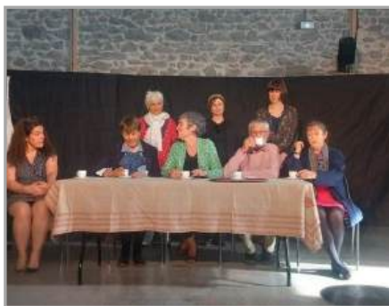
Théâtre avec la compagnie des 7 bosses