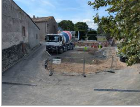
Seules des entreprises Audoises travaillent sur le projet