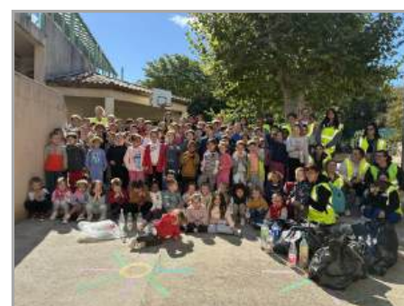
Nettoyons la nature le 22/09/2025