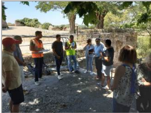
Les réunions de chantier hebdomadaires se succèdent depuis le 01/09/2025