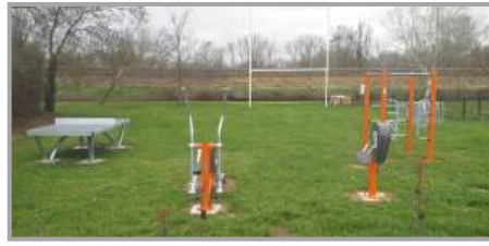
Aire de sport du Moulin