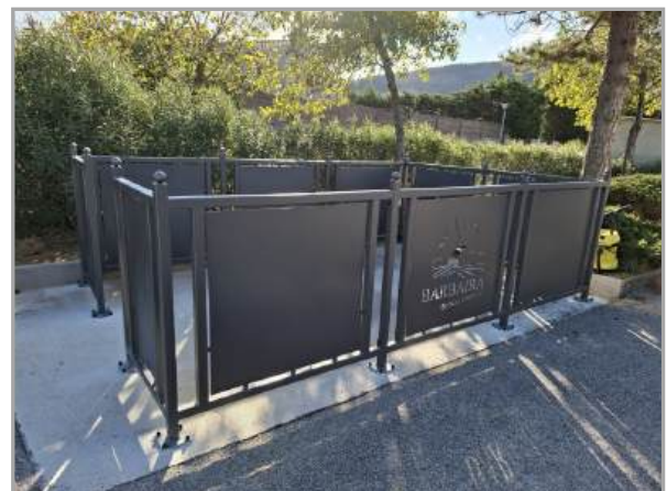
Mise en place des caches-conteneurs par l'entreprise DHOMPS Fabrice de COMIGNE rue du Moulin et Lotissement du Bouquet