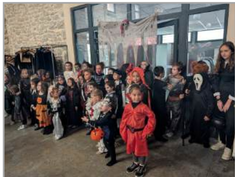
Halloween organisé par le Comité d'Animation