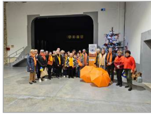
Orangez le monde avec le Club Soroptimist de Carcassonne