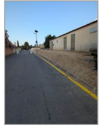
Des travaux de sécurisation dans le village réalisés par l'entreprise SIGNAL CBTP de TREBES