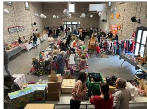
Marché de Noël organisé par le FACS