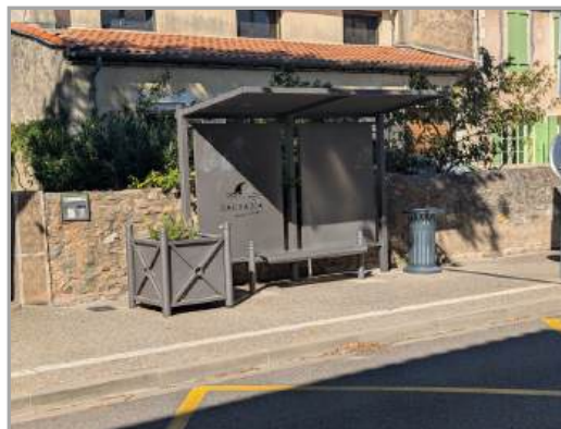
Plantation de romarins route de Carcassonne par les agents communaux