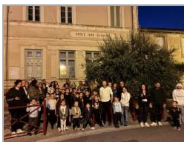
Randolune le 10/10/2025