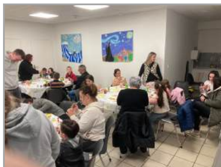
Atelier Peinture sur œufs proposé par le FACS