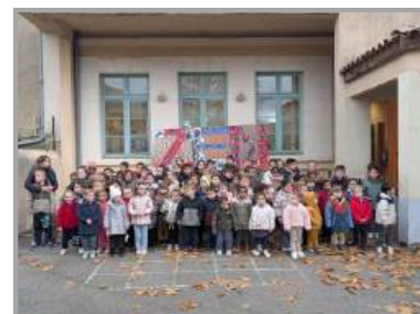
Fête de la Laïcité le 09/12/2025