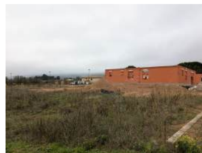
Lotissement Camin Nostra Dama : rue du Muscat