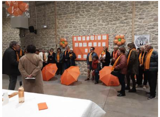
Orangez le monde en association avec le Club Soroptimist de Carcassonne