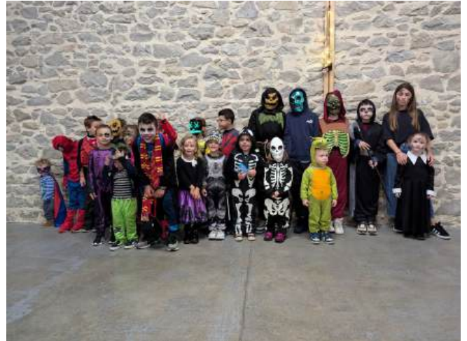
Halloween organisé par le Comité d'Animation