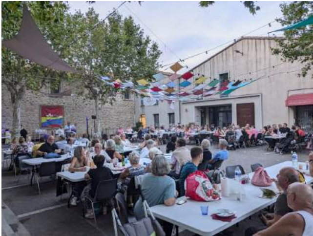
Soirée d'animation place du 14 juillet

Grâce à notre dynamique comité d'animation, les soirées de l'été permettent de se retrouver, d'échanger, de dialoguer et de passer un moment de convivialité.