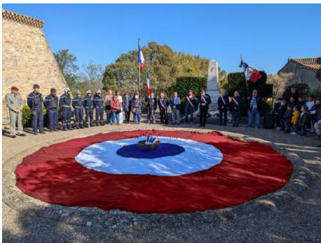
Commémoration du 11 novembre Devoir de mémoire au pied du monument aux morts