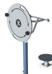
Roue twist & flex

Installation d'une table de ping-pong, de jeux de boules et de 4 appareils de fitness.