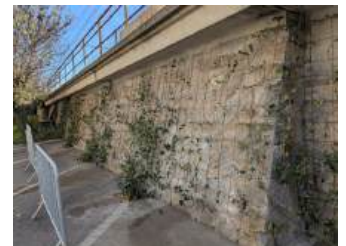
Mur du pont de la SNCF