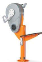
Vélo à bras