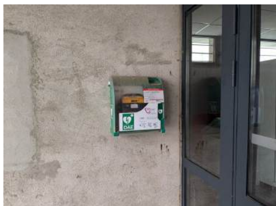
Salle André Laborie

Tous ces défibrillateurs font l'objet d'un entretien annuel avec changement des piles et des électrodes.