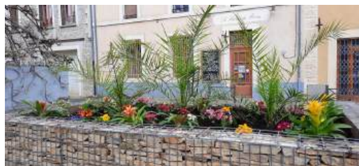
Gabillon place du 14 Juillet