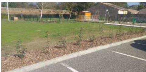
Haie ornementale parking du Moulin

Le projet de verdissement du mur du Pont de la SNCF a commencé.