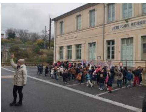
Fête de la laïcité le 9 décembre 2024 sur le thème de l'égalité fille/garçon