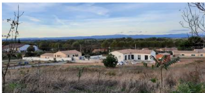
Lotissement de la Bretonne : rue des Arbousiers

2 Lotissements sont en cours de réalisation :