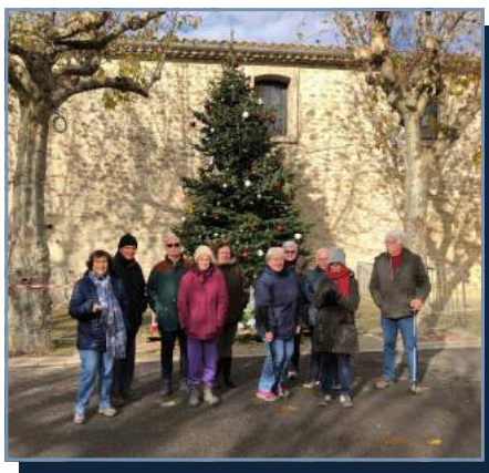
Départ marche loisirs devant le foyer