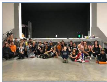
Zumba Halloween du 19 octobre