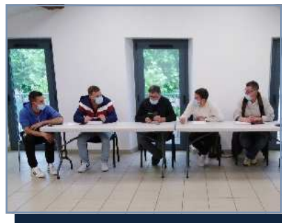
Bureau du Comité d'Animation

FACS : Cette année, la reprise des activités du FACS s'est faite avec deux nouvelles sections :