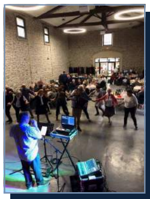
Repas du 13 novembre