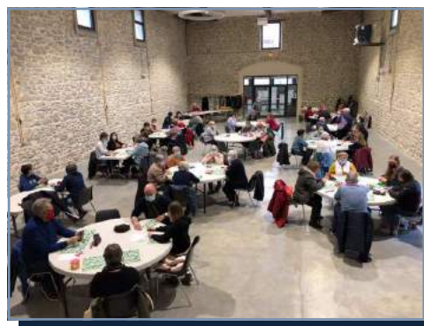
Loto du 5 décembre