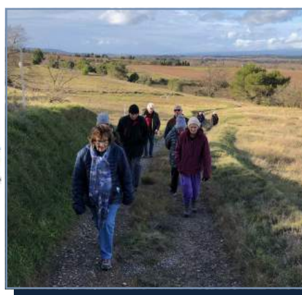
Marche loisirs du 9 décembre

GÉNÉRATIONS MOUVEMENT : L'association Générations Mouvement a également repris temporairement ses manifestations :