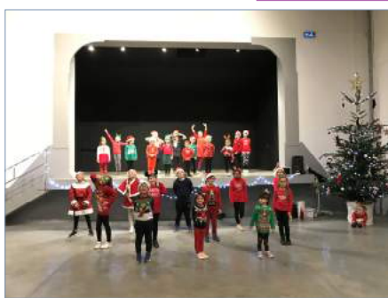
Zumba Kids - Spectacle de Noël du 14 décembre