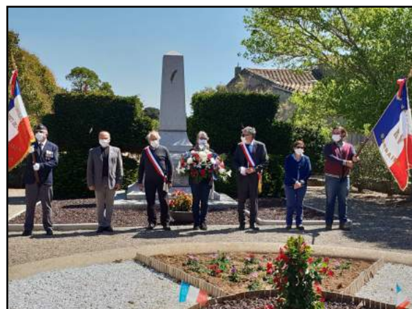
Cérémonie du 8 mai, place de l'Aïral

Les élus du Conseil Municipal et les représentants de l'association des Anciens combattants ont déposé au monument aux morts une gerbe au nom de la population Barbairanaise.