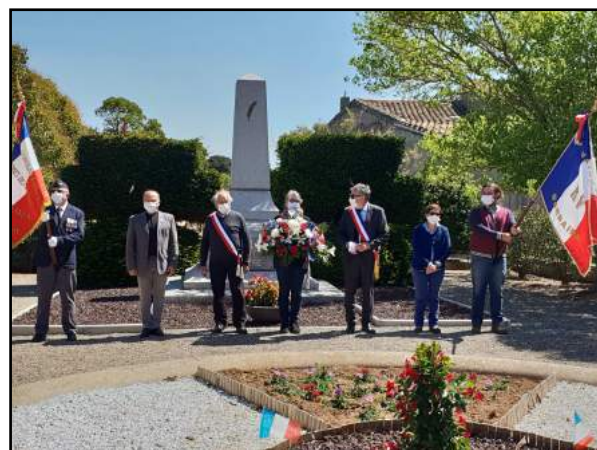
Cérémonie du 8 mai, place de l'Aïral

Les élus du Conseil Municipal et les représentants de l'association des Anciens combattants ont déposé au monument aux morts une gerbe au nom de la population Barbairanaise.