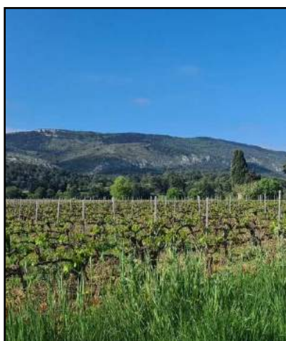
Vignes avec vue sur l'Alaric

Une permanence téléphonique des élus est mise en place à partir du lundi 7 juin 2021 pour les urgences en dehors des horaires d'ouverture du secrétariat de la mairie : 06.33.88.76.08