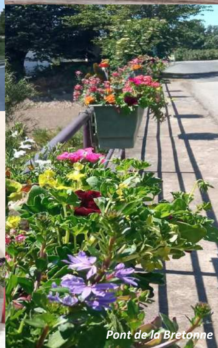
Pont de la Bretonne