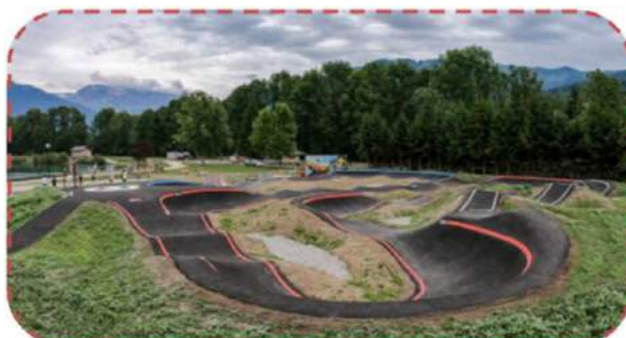
Exemple de pumtrack