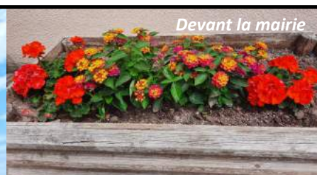
Devant la mairie