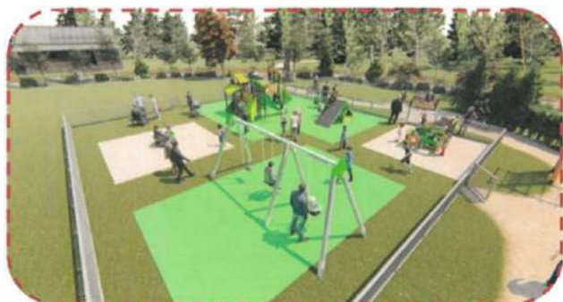
Exemple de jardin d'enfants

Plusieurs subventions ont été accordées à la commune pour leurs réalisations qui devraient débiter avant la fin de l'année.