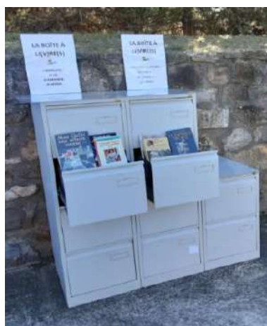
Rue de l'Église