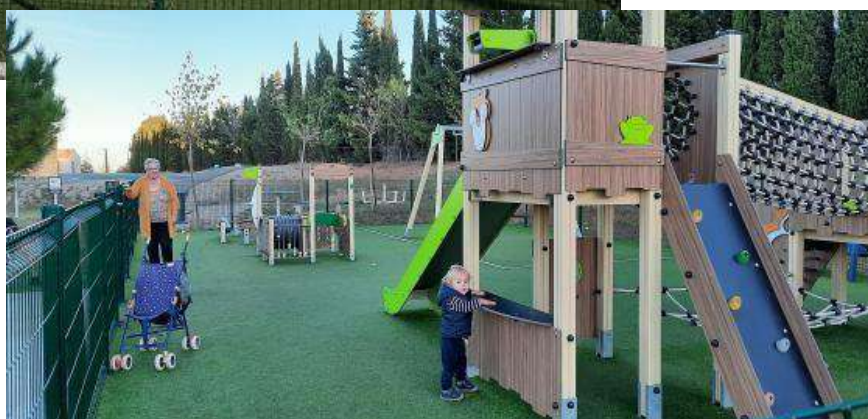
Jeux d'équilibre, tobogan, balançoires....