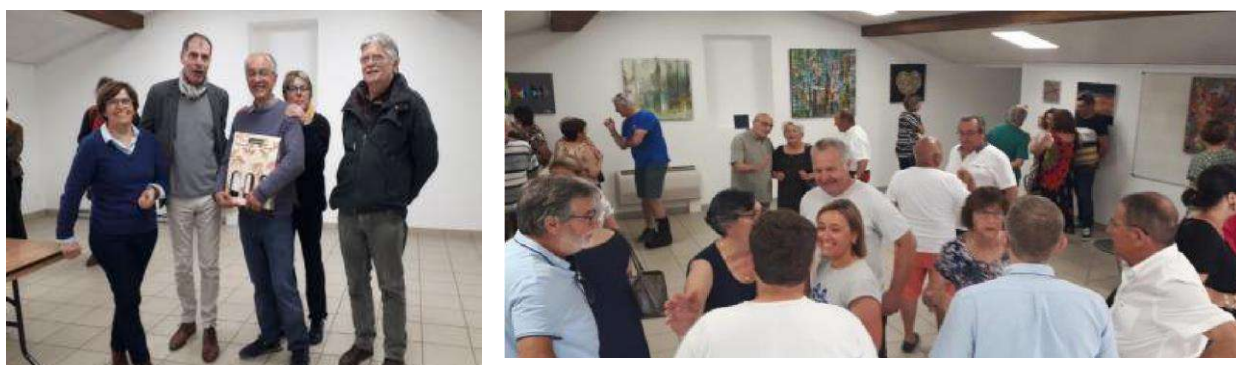
La salle Georges Brassens est le témoin de rencontres culturelles