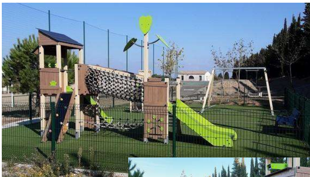
Aire du Jardin d'Enfants