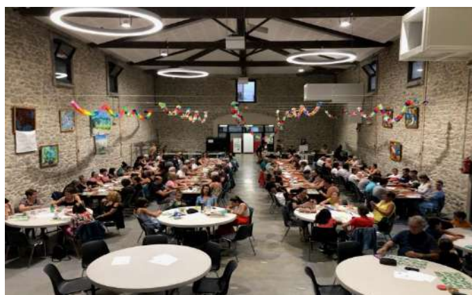
Loto dans la Salle André Laborie

Les installations municipales (salles, matériel...) sont mises gratuitement à disposition des associations du village. Ces associations sont subventionnées chaque année afin de leur permettre d'avoir une activité et des moyens d'investissements correspondants à leur activité.