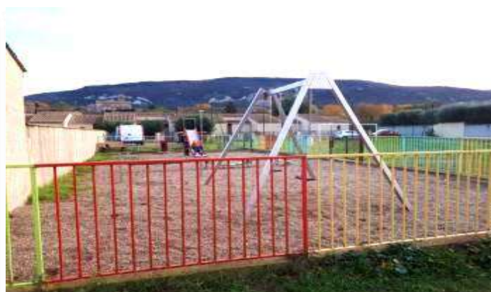
Rénovation Aire de Jeux du Breilh