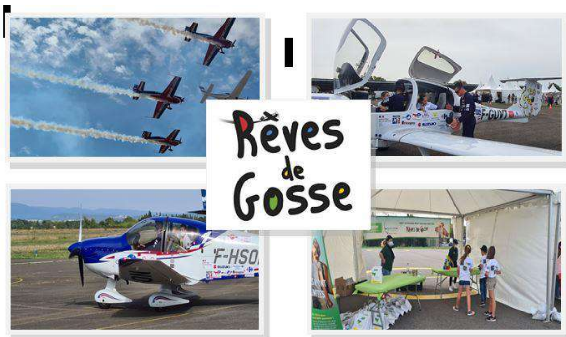
Sur le Tarmac de L'Aéroport Salvaza

Les CM et les CE ont profité de l'opération Rêves de Gosses sur l'aéroport de Carcassonne en 2020 et ont bénéficié d'un baptême de l'air, offert par l'Association qui a pour but de favoriser, l'Inclusion et accepter les différences au travers de rencontre entre enfants.