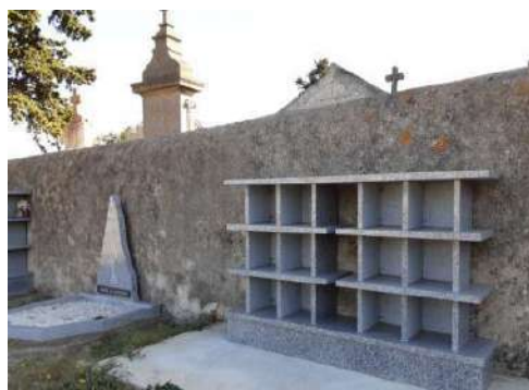
Colombarium en cours de réalisation

Côté cimetière, un nouveau colombarium est en cours de réalisation.