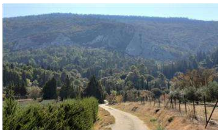
Chemin des combes