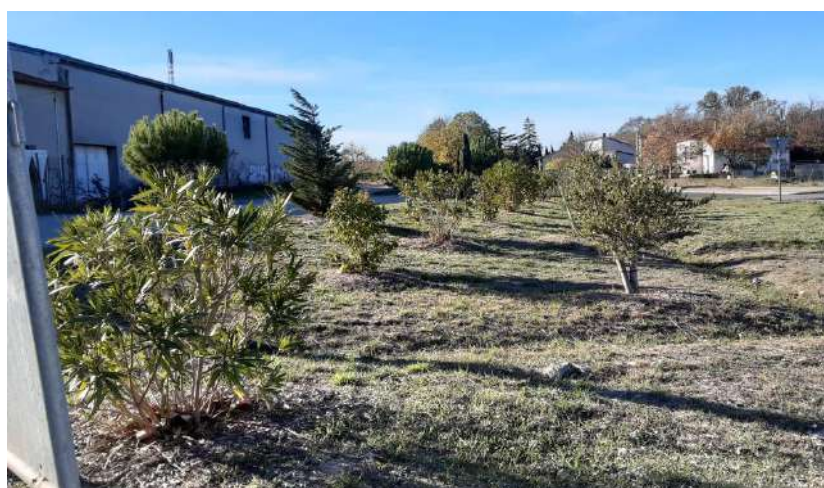
Rond-point ouest – cave coopérative

Notre engagement dans la plantation de poumons verts commence à l'entrée ouest avec la plantation de différentes essences méditerranéennes. Du Stade au Pumptrack, ces plantations amènent un peu de fraîcheur dans des périodes estivales.