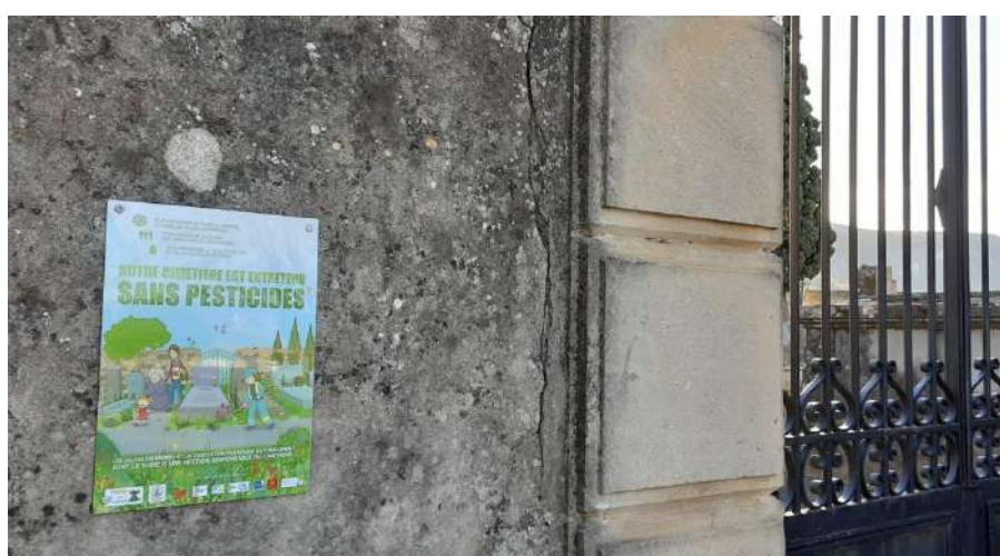
Entrée Cimetière, Label Terre saine