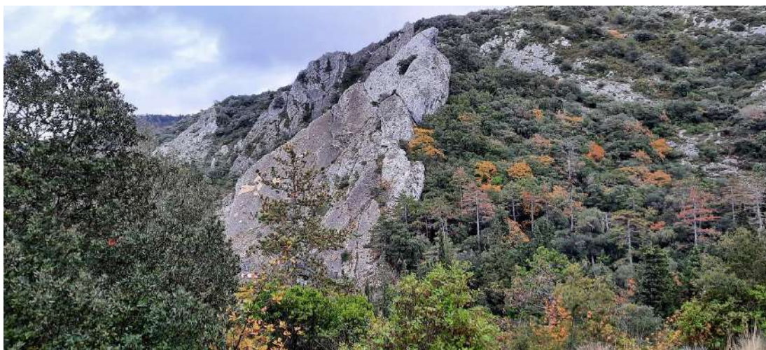
Roc du Four à Chaux dans le Massif de l'Alaric

Dernièrement, nous avons signé une convention de partenariat avec la Fédération Française d'Escalade pour ouvrir officiellement 6 voies d'Escalade entièrement sécurisées sur le Roc du Four à Chaux .