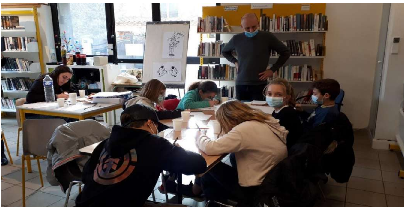
Animation dans les locaux de la Bibliothèque Gaston Bonheur