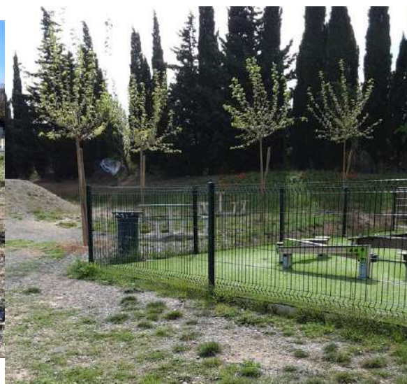
Aire de jeux du stade