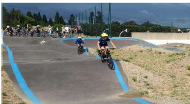
Piste pour pratiquants aguerris