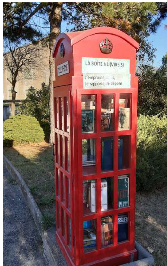
Lotissement Le Bouquet