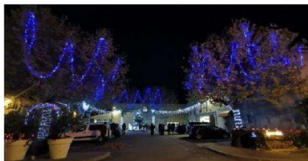
Place du 14 Juillet illuminée