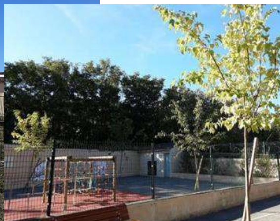
Jardin Pédagogique - Rue du Moulin