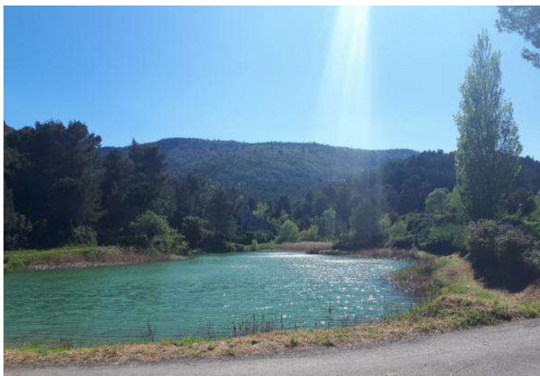
Lac de la Fount de Mounel