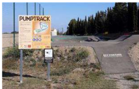
Entrée avec les Consignes de Sécurité

Au stade, le Pumptrack avec différentes catégories de pistes (débutants, aguerris et sportifs) fait la joie des pratiquants de bike, roller et skate. Très fréquentée, cette piste de glisse attire les adeptes de sensations fortes.