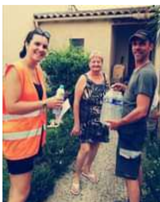
Agents distribuant de l'eau et brumisateur