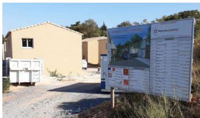
Rue des Oliviers – Lotissement Le Petit Pré

D'ores et déjà, de jeunes couples Barbairanais qui n'avaient pas la possibilité de se loger ont postulé pour ces logements. Cette réalisation a été portée par l'entreprise GRANELL de Barbaira.