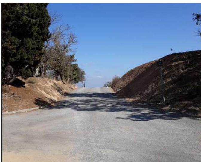
Agrandissement de l'entrée du Chemin de la Peillère

Les vignerons ont profité d'un plan important de rénovation de chemins ruraux, la Tuilerie, Mayrac sud, Saut de l'eau, la Pomme, la Peillère et le Tonkin. Ces travaux ont obtenu des subventions de l'État et du Département.