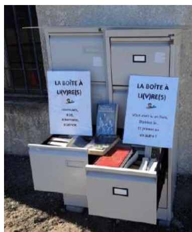
Rue du Stade