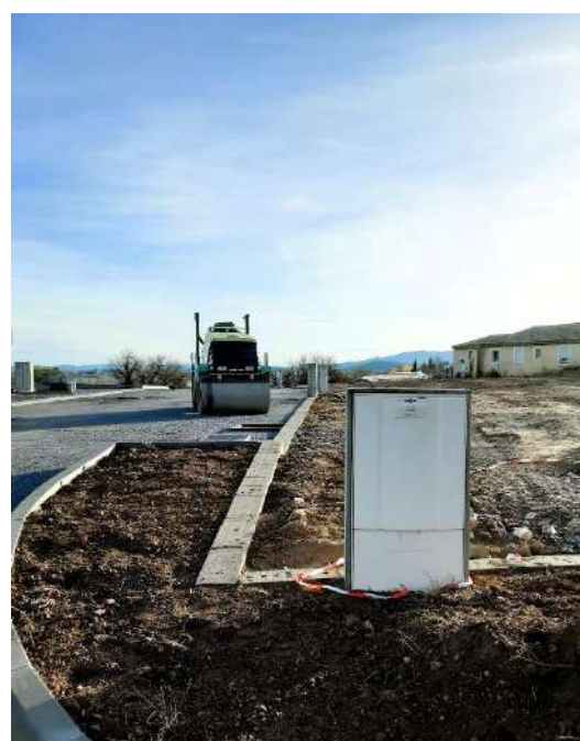
Futur Lotissement Camin de Nostra Dama Rue du Muscat