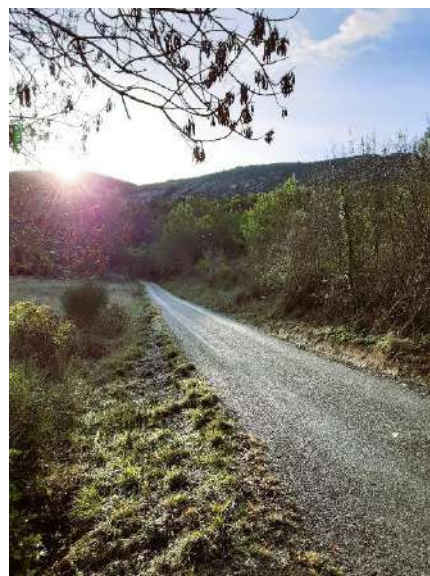
Rénovation partielle du Chemin de la Tuilerie