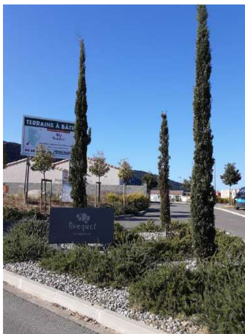
Lotissement Le Bouquet II Rue du Thym

6 nouvelles maisons individuelles sont en construction dans toute la commune.