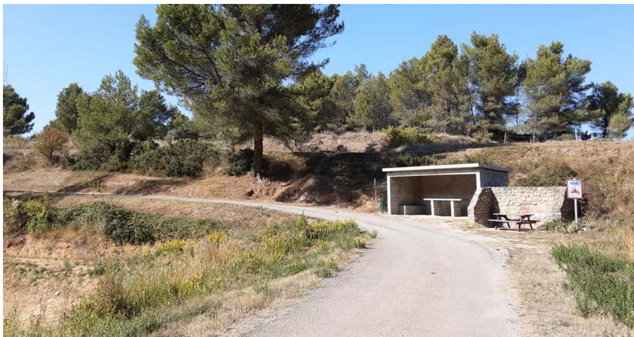
Construction d'une cabane en dur au Lac

Au Lac de la Fount de Mounel, la construction d'une cabane en dur et la réfection des berges apportent à ce site un complément de confort aux associations de pêche et aux promeneurs qui souhaitent faire une pause.