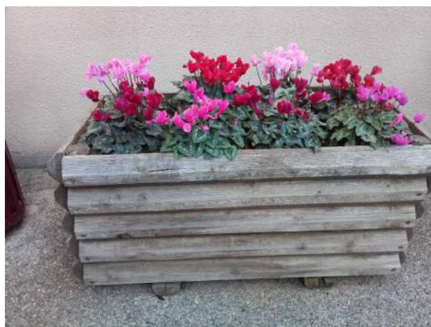
Les cyclamens devant la mairie apportent une touche de couleur