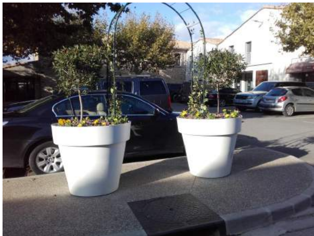
Pots sur la place du 14 Juillet : Jasmin, pensées, qui embaumeront la place dès le printemps

Un paysage cohérent pour un village plus attrayant.