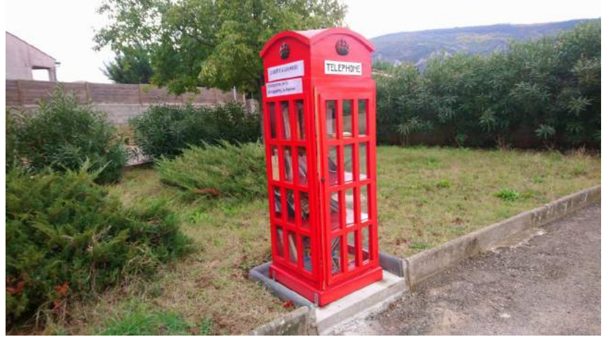
Offerte par le club d'échec Piémont d'Alaric

ON S'Y SERT EN LIBRE SERVICE, ON CHOISIT UN LIVRE, ON DÉPOSE LE SIEN.