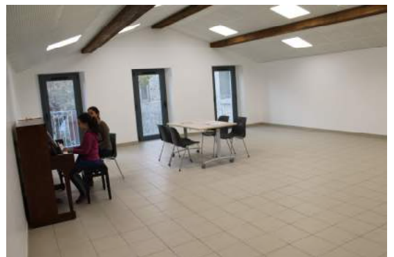
Salle Georges Brassens