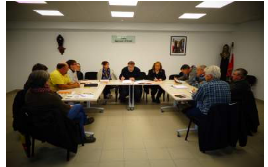
Salle Bernard Létuvé