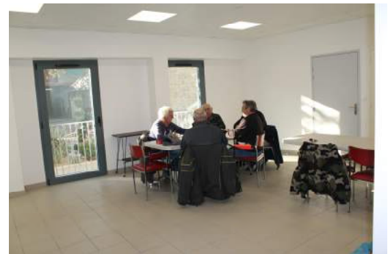
Salle des Associations